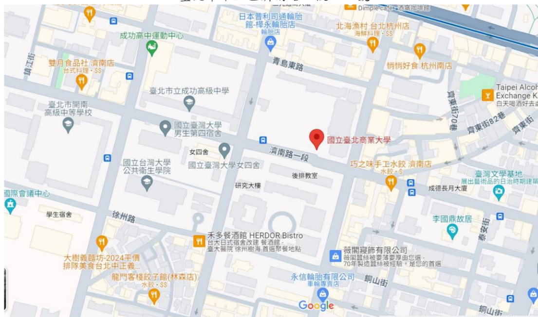
(臺北商業大學 google 地圖)