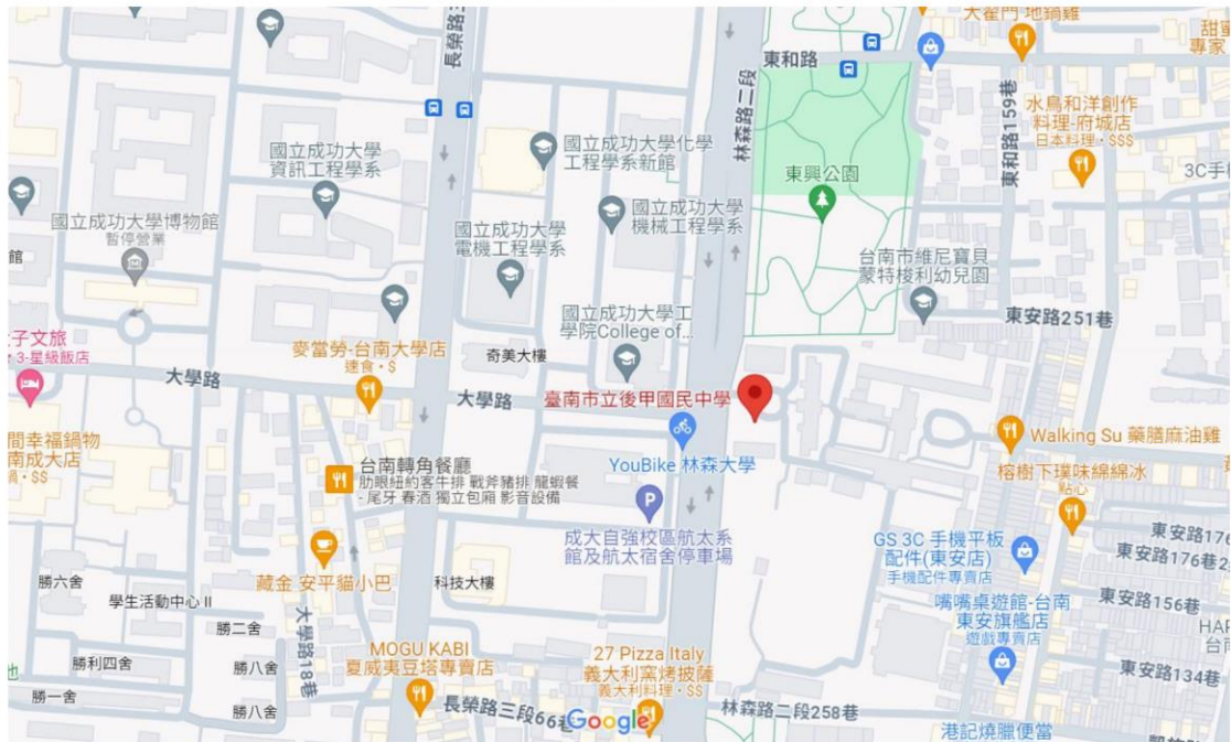
(後甲國中 google 地圖)