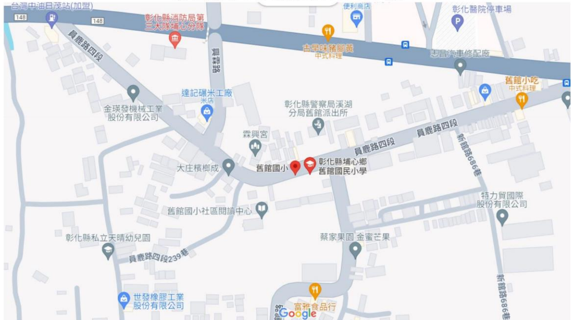
(舊館國小 google 地圖)